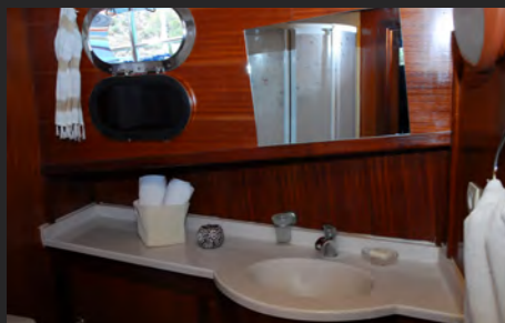
BAGNO / BATHROOM