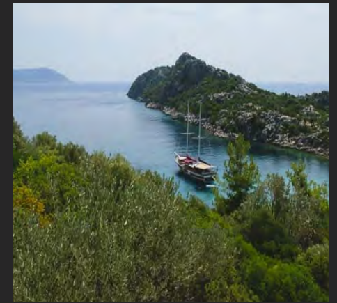
PENISOLA DI BOZBORUN