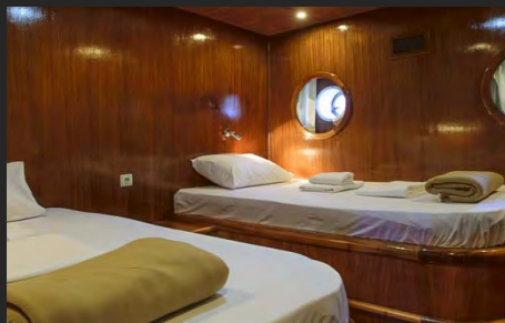
CABINA DOPPIA / DOUBLE CABIN