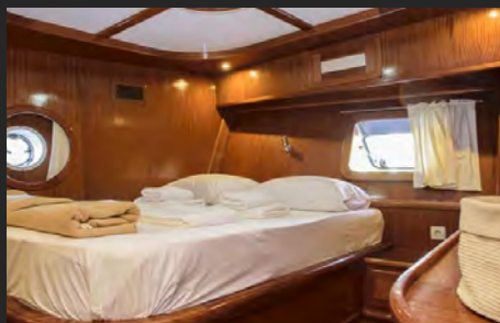
CABINA DOPPIA / AFT CABIN